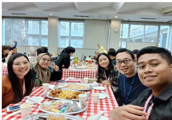
ウェルカムパーティー